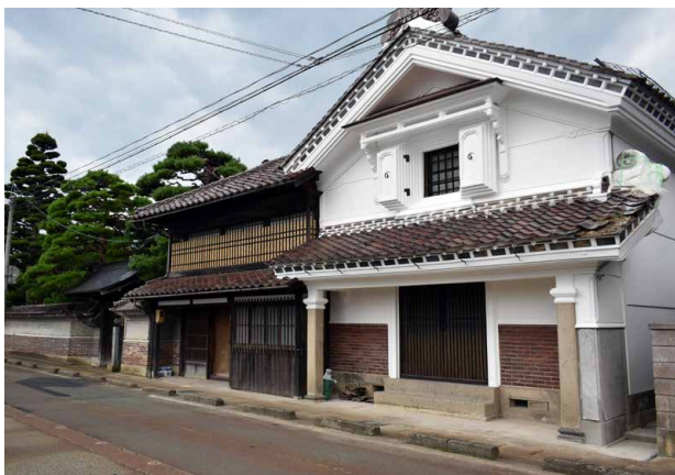
レンガや柱に洋風建築の影響がみられる清野家（2017.8）