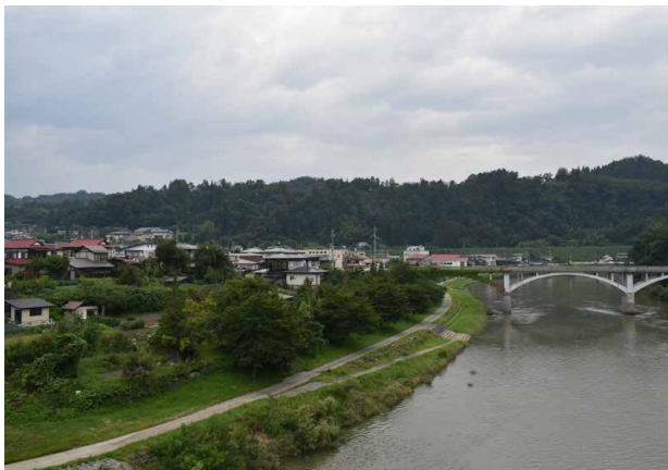
旧最上橋と河岸段丘上の米沢船屋敷跡（2017.8）