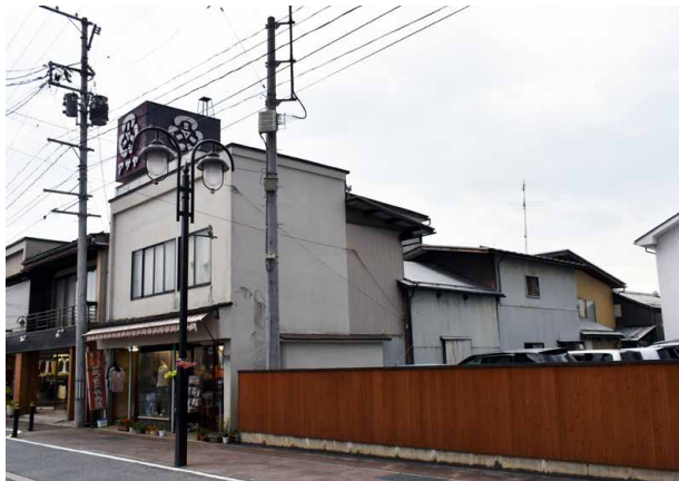
城下町由来の短冊地割が残る（2017.8）