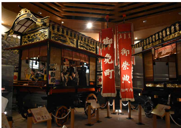
左沢駅前的大江町商工会に展示される囃子屋台（2017.8）