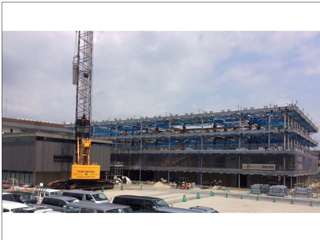
南棟外装仕上工事、北棟3・4階躯体工事状況 (平成29年7月)