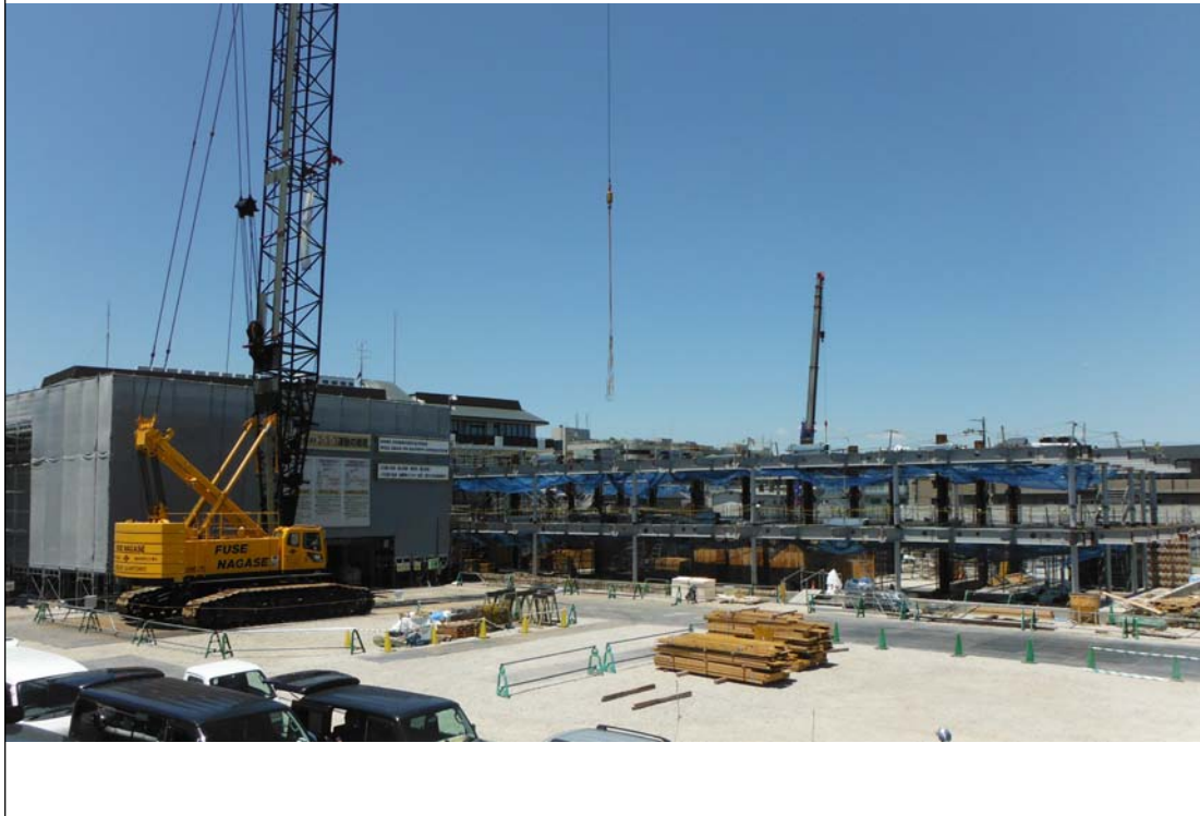
北棟1・2階躯体工事状況 (平成29年5月)