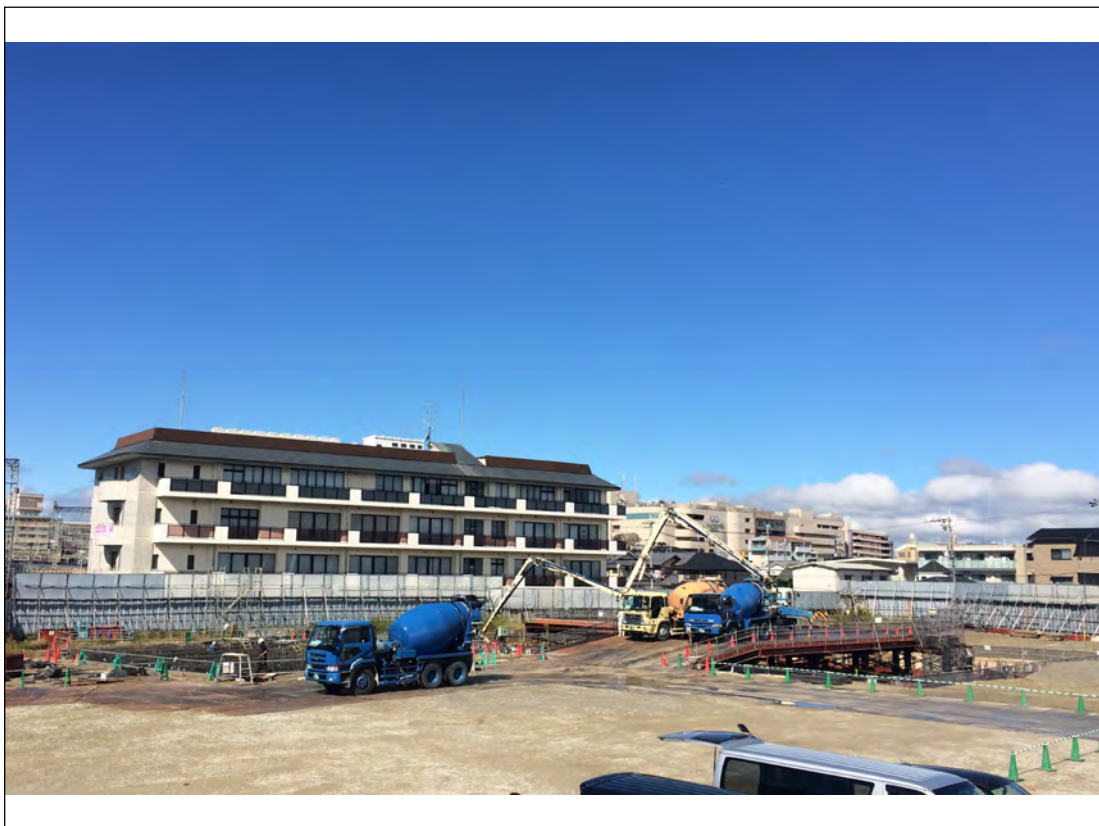
基礎工事状況 (平成28年10月)