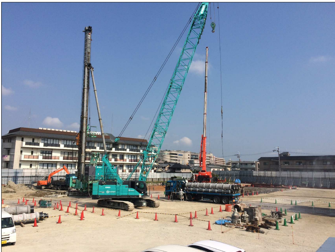
地下掘削及び杭工事状況（平成28年8月）