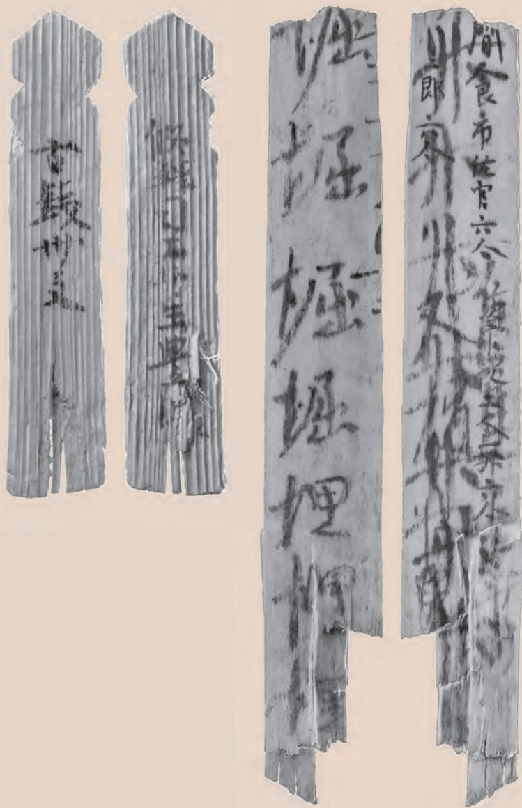
西隆寺跡出土お木簡 / 縮尺左：原寸、右：80%

しかし、昭和四〇年代の発掘調査以降、次第にその姿が浮かび上がってきました。特に東門近くの土坑からはたくさんのお木簡が出土しました。お木簡に書かれた内容は奈良時代末期の西隆寺の造営に関係するもので、人々の食料支給文書やその帳簿、諸国からの貢進荷札、官司や個人からの智識銭付札など多岐にわたっています。これらは、寺院関係のまとまった文字史料として、お木簡研究のみならず奈良時代の寺院史、社会経済史において、たいへん貴重であることから、二〇二五年九月二六日に「西隆寺跡出土お木簡」七五点が重要文化財に指定されました。これを記念して、本展ではお木簡の実物一六点を展示します。みなさまには、貴重な文化財に接し、それらを保護することの意義と奈良の歴史の奥深さについてご理解いただければ幸いです。