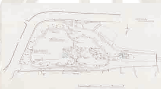
円成寺庭園昭和51年度整備工事設計図(検討図)