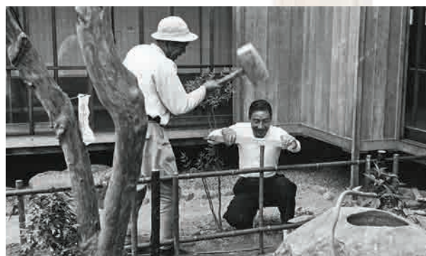
東大寺龍藏院庭園、施工の様子(1957年)