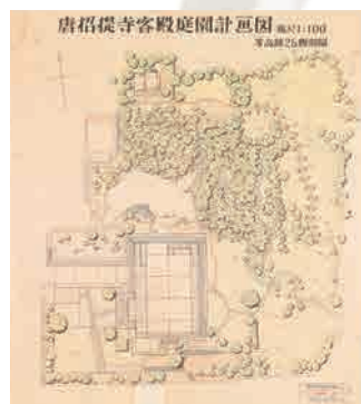
唐招提寺客殿庭園計画図(1956年)