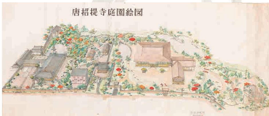
唐招提寺庭園絵図(1961年)