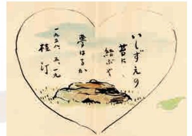
うちわ絵(東大寺龍藏院庭園、1958年)