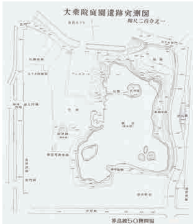
大乘院庭園遺跡実測図(1956年)