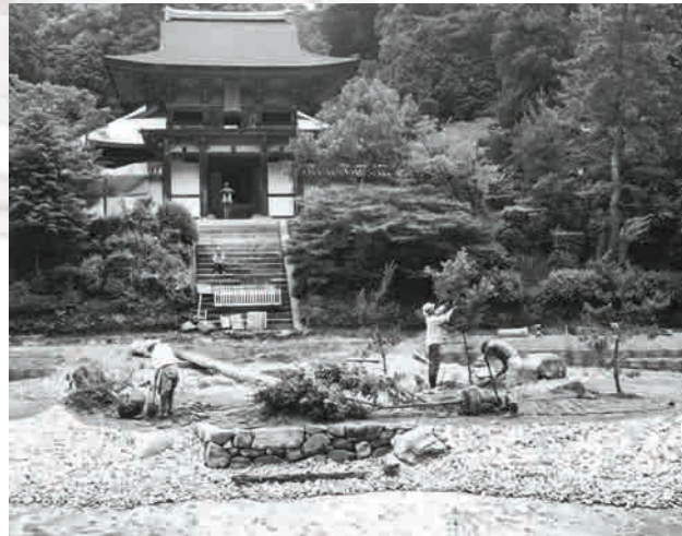
円成寺庭園 整備工事の様子(1976年)