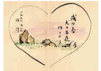
うちわ絵(法華寺仔犬の庭、1958年)