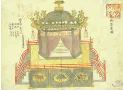
「弘化四年御即位諸礼式図 高御座略図」 〔『即位の礼と大嘗祭—資料集—』神宮文庫編 国書刊行会〕