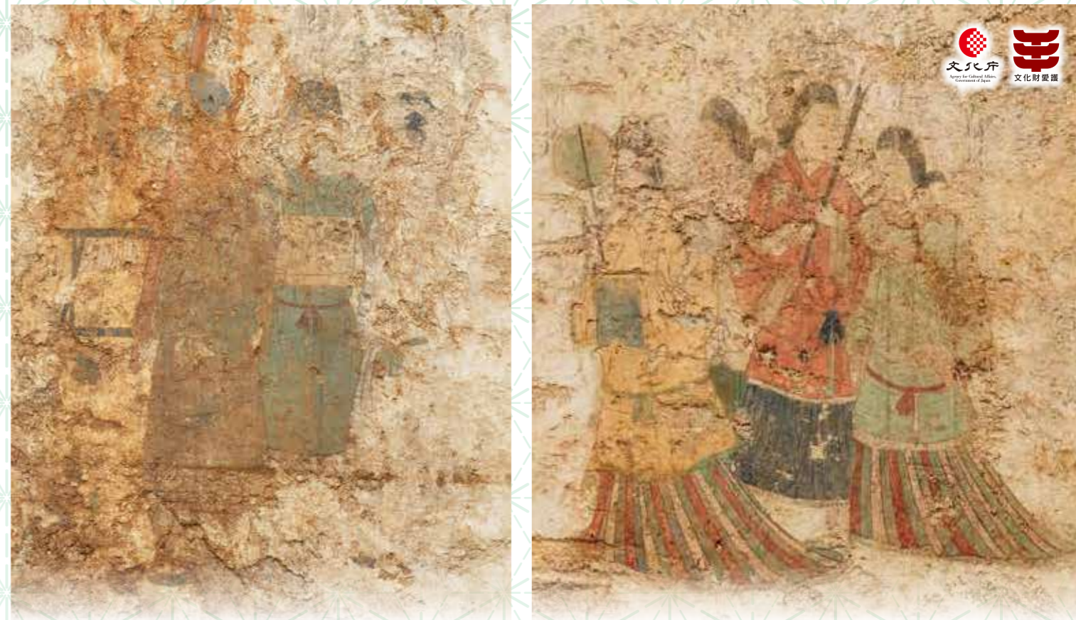
西壁男子群像・西壁女子群像(令和元年撮影)