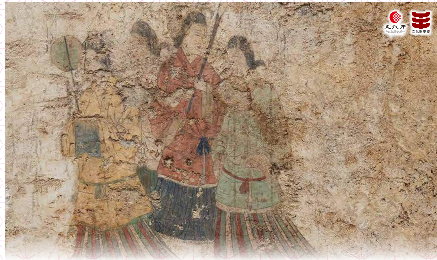
西壁女子群像(令和元年撮影)