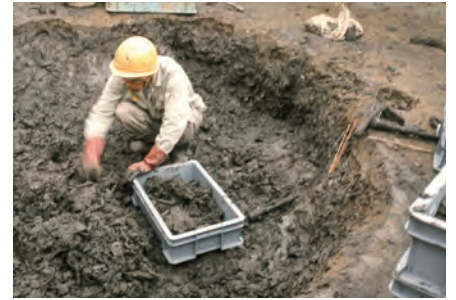
▲木簡を検出している様子