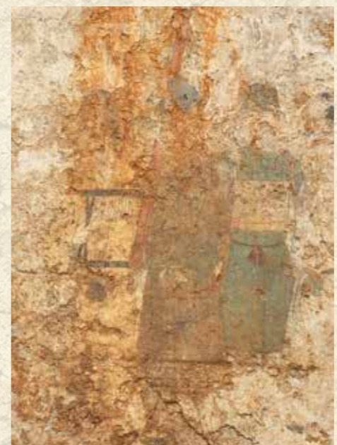
西壁男子群像 (平成30年撮影)