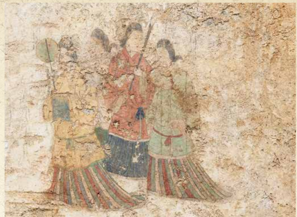
西壁女子群像 (平成30年撮影)