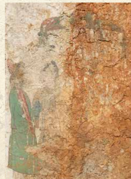
東壁男子群像 (平成30年撮影)