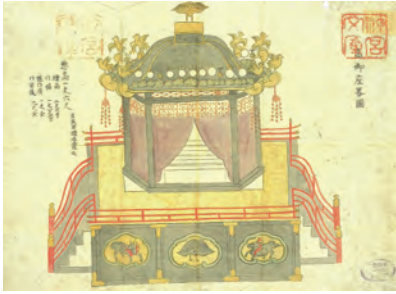
「弘化四年御即位諸礼式図 高御座略図」 〔『即位の礼と大嘗祭—資料集—』神宮文庫編 国書刊行会〕