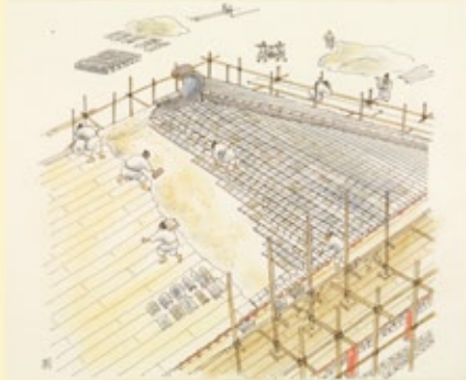
飛鳥寺造営当時の瓦葺き