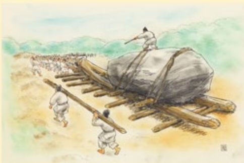
石舞台古墳の造墓

2015年の発掘調査で大極殿南面には3つの階段があったことがわかりました。その調査結果を反映させるため、完成していたイラストの階段部分が描き直されました。