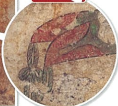
● 高松塚古墳東壁 男子群像