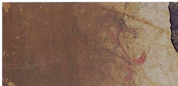
● キトラ古墳東壁 青龍 可視光

同じ壁画でも赤外線画像では墨線が見やすくなるなど、可視光と比べ、ずいぶん異なった見え方をします。