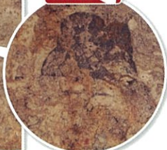
● 高松塚古墳西壁 男子群像