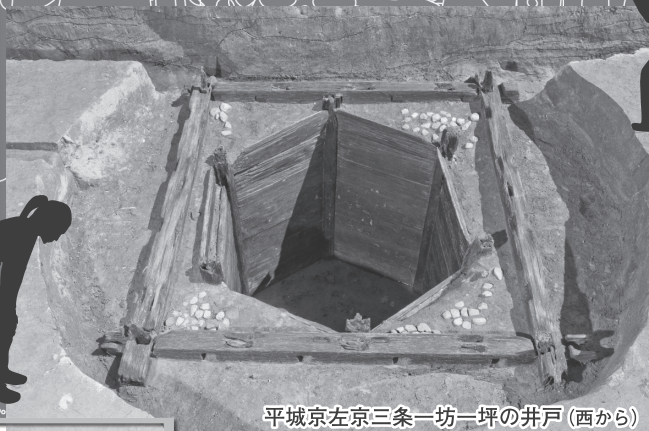
平城京左京三条一坊一坪の井戸(西から)