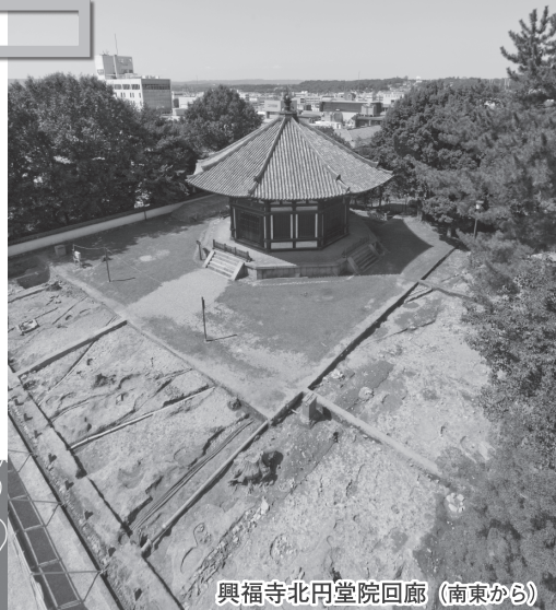
興福寺北円堂院回廊(南東から)

床に敷かれた遺構図面の上を歩きながら、実際に発掘現場を探索するような気分で、会場をまわってみてください。