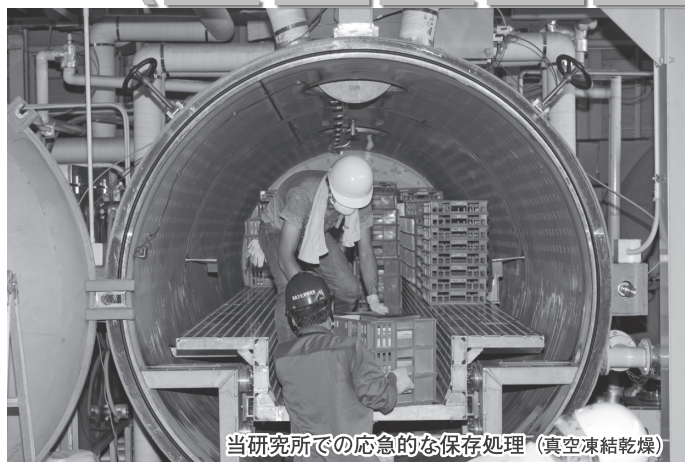
当研究所での応急的な保存処理(真空凍結乾燥)