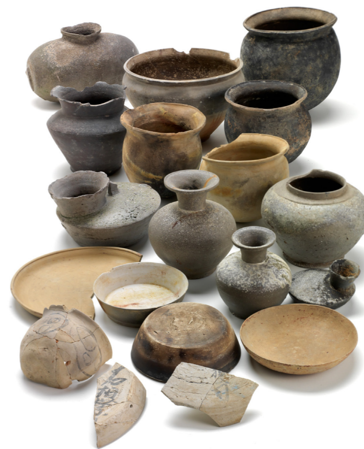
井戸から出土した土器

第1回目となる昨年度の調査(平城第478次)では、敷地の東よりに南北に長いトレンチを入れて調査をおこないました。坪を南北に二分する東西方向の道路と、その北に大きな井戸がみつかりました。井戸の規模は平城京でも最大クラス、井戸枠の上段は方形、下段は六角形という特殊な構造のものでした。中段の部分には小礫を敷いて美観を整えています。上段の井戸枠は長さ約2.4m、六角形は一辺約1.1mの大きさで、深さは井戸枠が残っていた面から約2.3mです。