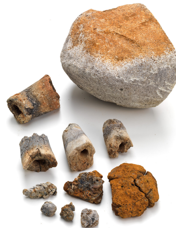
工房から出土した鉄滓・羽口・金床石

工房の近くでは、大量の炭を使っていたため、炭を含む真っ黒な土が一面に広がっていました。工房付近の溝や土坑につまった土には、木炭とともに工房に関連する遺物が入っていました。なかでも多いのが、炉に風を送る「ふいご」の先に取り付ける羽口です。現時点で70～80点を数え、まだまだ増えると予想されます。また、鉄を鍛造加工するときに出る鉄滓も多量に含まれていました。この鉄滓のタイプと、炉の大きさなどから、小型の鉄製品を鍛造で加工していたことが推定されます。工具ならば斧など、建築部材ならば釘など、武器ならば鉄鎌などを作っていたと推定されます。鉄製品の出土はきわめて少ないですが、鉄釘が1点確認できました。その他、金床石と呼ばれる赤熱した鉄を叩く台に使われた石が10数点、砥石が1点確認できています。